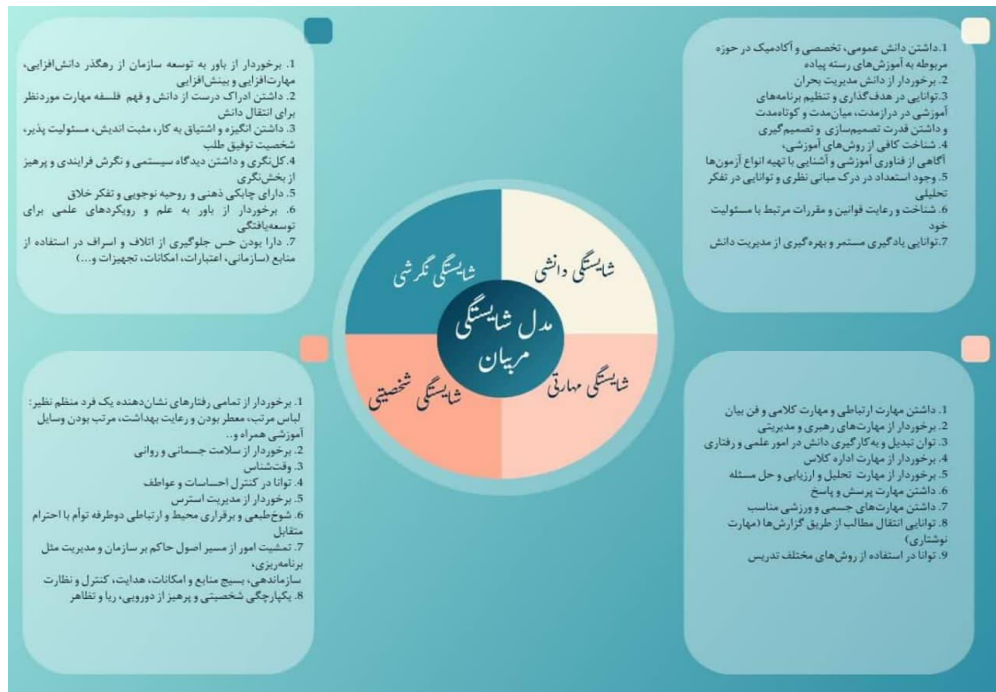
شکل ۱. مدل شایستگی استادان مراکز آموزشی / فرهنگی نذاجا

با توجه به نتایج به دست آمده، بیشترین اولویت مربوط به شایستگی شخصیتی با میانگین ۴/۸۲ و انحراف معیار ۰/۲۷۵ بوده و شایستگی مهارتی با میانگین ۴/۷۷ و انحراف معیار ۰/۱۹۶؛ شایستگی نگرشی با میانگین ۴/۶۶ و انحراف معیار ۰/۳۸۴ و شایستگی دانشی با میانگین ۴/۰۹۵ و انحراف معیار ۰/۵۲۴ به ترتیب اولویت‌های بعدی مدل شایستگی مربیان مرکز فرهنگی - آموزشی پیاده نذاجا بوده است.